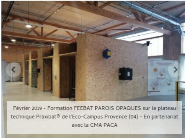
Février 2019 - Formation FEEBAT PAROIS OPAQUES sur le plateau technique Praxibat® de l'Eco-Campus Provence (04) - En partenariat avec la CMA PACA