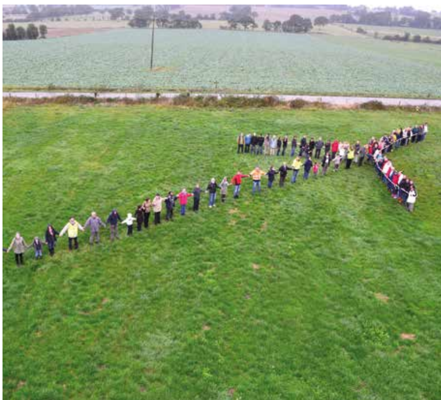
A Martigné Ferchaud, des citoyens se mobilisent pour créer un parc éolien participatif

« N otre pays a toujours été un État. Il doit devenir une société adulte ». En plein débat parlementaire sur la transition énergétique, alors que les dogmes nucléaires sont mis à mal par des échecs retentissants et des coûts galopants, la publication par l'ADEME d'une très sérieuse étude, « Vers un mix électrique 100% renouvelable en 2050 », apparaît comme une prise de position particulièrement forte ! Ainsi voit-on entérinée implicitement la voie de l'efficacité énergétique, des énergies renouvelables et de la responsabilité majeure des acteurs territoriaux, suivie par le CLER depuis trente ans et modélisée dans le scénario négaWatt il y a dix ans ! Sur ce chemin, le mouvement s'amplifie de jour en jour. De plus en plus nombreux, les citoyens, les entreprises, les collectivités, les administrations et des responsables de l'État décident et agissent dans ce sens à leur niveau, comme des adultes, sans toujours attendre les lois, les aides ou la protection de l'État. A nous, nos membres et nos partenaires de veiller à la cohérence et à l'efficacité de ce mouvement grâce aux organisations que nous contribuons à renforcer ou à créer dans tous les territoires : Agences régionales ou locales de l'énergie, Espace Info Énergie, plateformes pour la rénovation énergétique, Territoires à énergie positive... Cette prise de responsabilité par la base n'est-elle pas une véritable révolution tranquille, moment historique qui peut changer la France ?