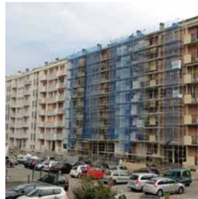
Barre Le Mangin, Grenoble, copropriété ayant bénéficié de la campagne isolation MurlMur.

L'évaluation de mur/mur a permis plus qualitativement de pointer les atouts et les faiblesses et de les intégrer dans la réflexion sur le montage d'un nouveau dispositif. Les atouts de l'opération reposent essentiellement sur la qualité de l'accompagnement, les niveaux de financement mobilisés, l'appropriation du sujet par les acteurs du bâtiment et l'existence d'un dispositif similaire pour le parc social. Des faiblesses ont néanmoins été relevées : le peu de temps d'accompagnement dédié aux copropriétés au regard de la difficulté de la prise de décision et de gestion des dossiers, la complexité de l'instruction financière, les problèmes d'accès aux données de consommation pour l'évaluation... L'adhésion des ménages au dispositif est parfois difficile à obtenir, en raison d'un déficit de confiance envers les professionnels, de la faible implication - voire des réticences - de