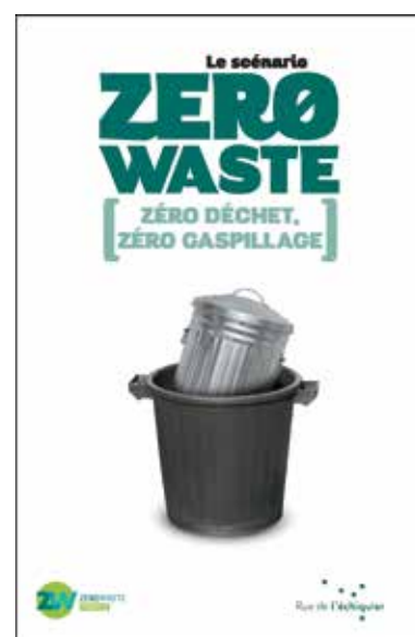
L'association Zero Waste France a publié son scénario pour des territoires zéro déchet, zéro gaspillage, en novembre 2014, aux éditions Rue de l'échiquier.

un sujet important de débat et de tensions dans les deux Assemblées. Malgré nos efforts, la généralisation du tri à la source des biodéchets se cantonne pour l'instant aux ménages et aux gros producteurs, et l'interdiction de nouvelles installations de Tri Mécano-Biologique que nous soutenons a été supprimée par le Sénat. L'objectif de ces installations est de séparer la matière organique des ordures ménagères résiduelles pour en faire du compost ou les méthaniser. Or, elles entrent en concurrence avec la diffusion du tri à la source des déchets organiques, la solution la plus optimale pour un retour au sol de qualité. Enfin, l'association a milité, avec succès, pour un moindre encouragement à la création d'une filière de combustibles fabriqués à partir de déchets (CSR), pour que la France donne la priorité à l'amélioration du « process » de tri et la recyclabilité des matériaux avant de les destiner à la fabrication d'énergie.